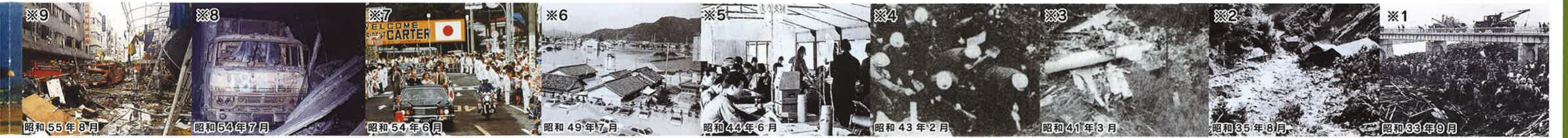
昭和55年8月 ※9 昭和54年7月 ※8 昭和54年6月 ※7 昭和49年7月 ※6 昭和44年6月 ※5 昭和43年2月 ※4 昭和41年3月 ※3 昭和35年8月 ※2 昭和33年9月 ※1